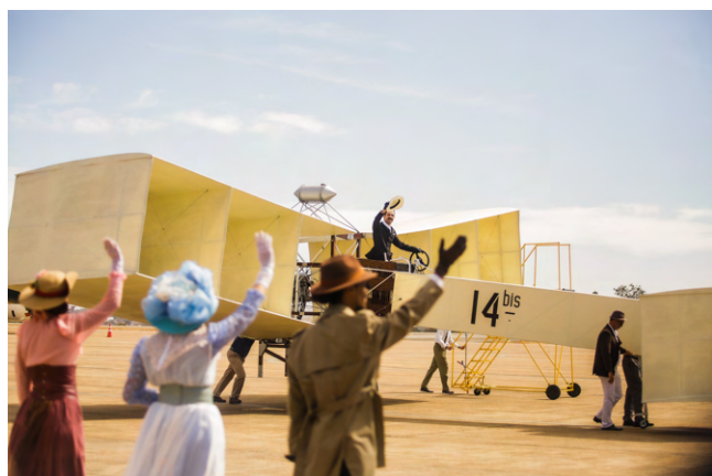
A honraria marcou os 150 anos de nascimento de Alberto Santos Dumont

A honraria foi entregue durante a comemoração dos 150 anos de nascimento de Alberto Santos Dumont, pai da aviação e patrono da Força Aérea Brasileira (FAB). A cerimônia contou com desfile de tropa, sobrevoos de aeronaves da FAB, participação especial da Esquadrilha da Fumaça, além de encenação teatral sobre a vida e obra de Santos Dumont.