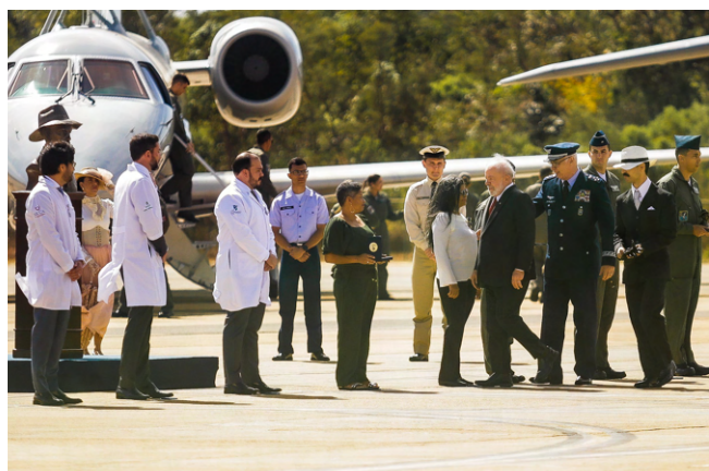
A medalha foi entregue pelo Presidente do Brasil, Luiz Inácio Lula da Silva