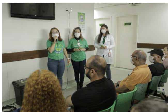
O evento foi realizado no dia 13 de julho, no ambulatório de Atendimento