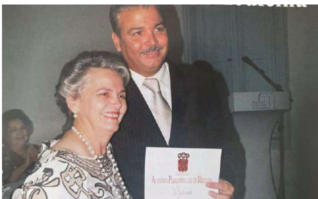
Posse na Academia Pernambucana de Medicina