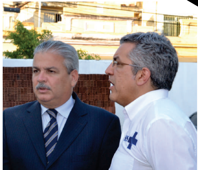
Inauguração do Banco de Multitecidos

Reorganização da política estadual de regulação assistencial; Implantação de quatro centrais de regulação em Recife, Serra Talhada e Petrolina; e de 12 centrais regionais nos municípios sedes de cada Regional de Saúde; Inauguração do Banco de Multitecidos; Instituição de câmaras técnicas estaduais de transplante de rins, fígado e córneas;