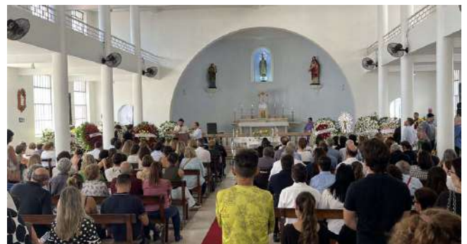
Capela do IMIP