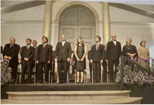
Autoridades que prestigiaram a cerimônia