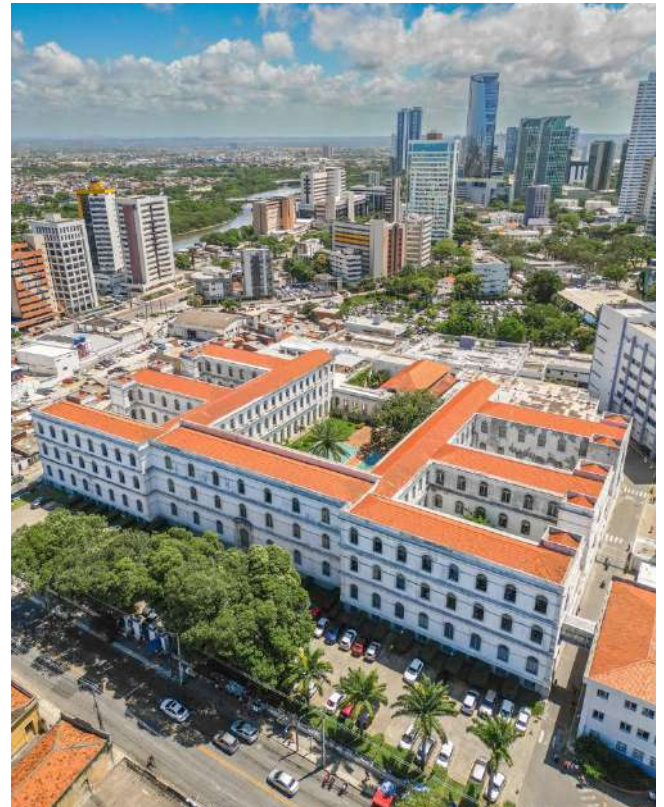
Imagem aérea do Hospital Pedro II

O novo Hospital Pedro II também abrigou a Presidência, o Museu, a nova sede da Fundação Alice Figueira e do Voluntariado,