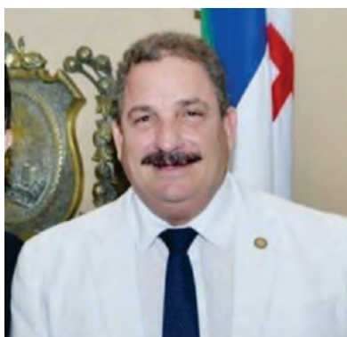
Deputado Federal, Eriberto Medeiros

“Recebi com muita tristeza o falecimento do grande amigo Antônio Carlos Figueira, que deu notável contribuição para o Governo de PE, especialmente fortalecendo a rede estadual de saúde, e foi grande defensor da ação social da medicina através do IMIP. Figueira foi ator fundamental para as transformações que PE viveu. Deixa enorme lacuna na sociedade pernambucana. Que Deus conforte seus familiares e amigos nesse momento de dor.”