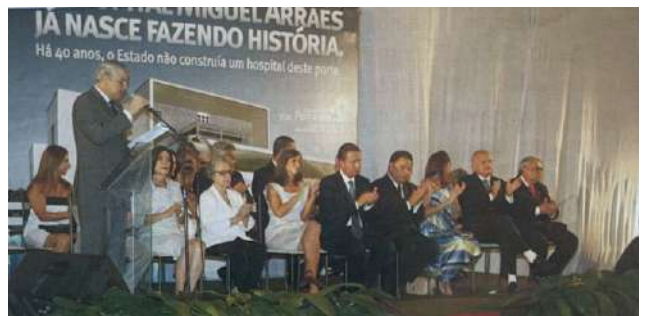
Inauguração do Hospital Miguel Arraes