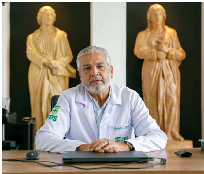
Antônio Carlos Figueira

Em julho de 2021, em meio à pandemia de Covid-19, foi inaugurado o Centro de Eventos Prof. Fernando Figueira, destinado à realização de congressos e conferências. O espaço, todo equipado com tecnologia de ponta, conta com auditório, foyer, anfiteatro e salas modulares que comportam até 220 lugares