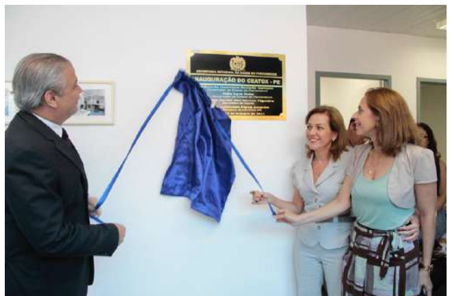
Inaugurando a sede do Ceatox, em 19 de outubro de 2011