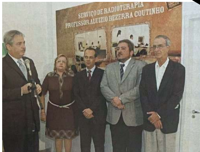
Inauguração do primeiro Serviço de Radioterapia de Pernambuco pelo SUS