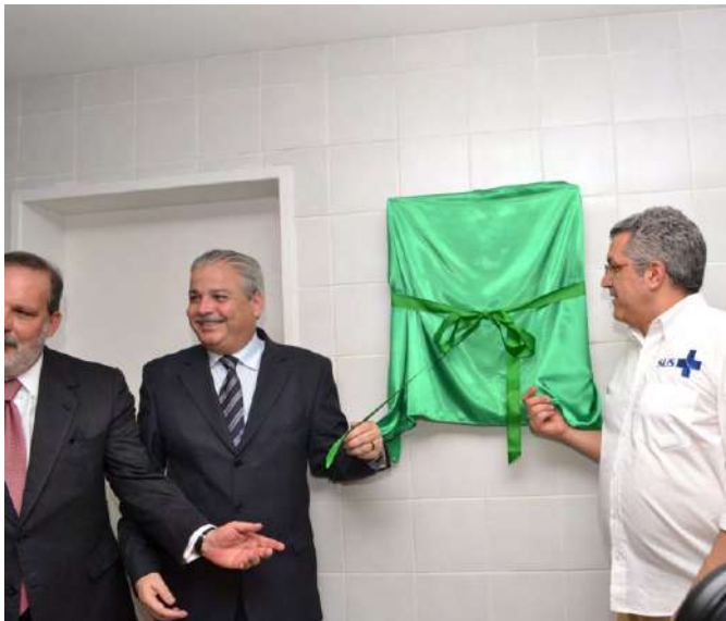
Inauguração do Banco de Multitecidos