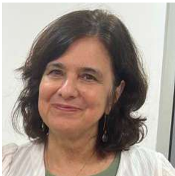
Ministra da Saúde, Nisia Trindade Lima