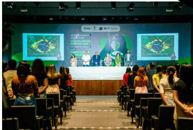
Centro de Eventos Prof. Fernando Figueira