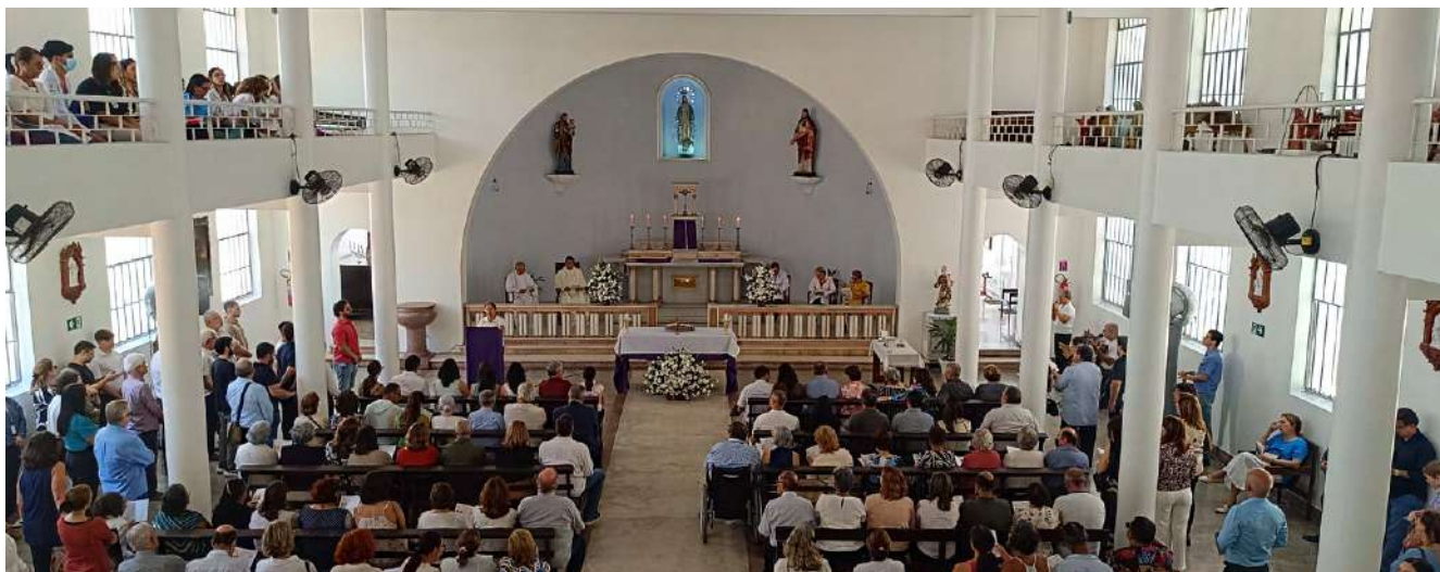
Capela do IMIP