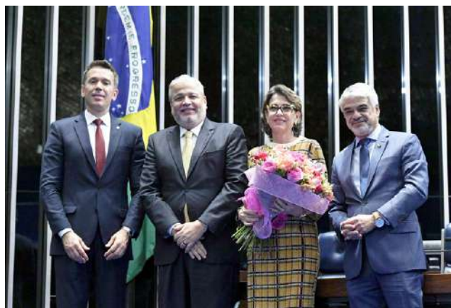
Homenagem no Senado

Assessor Especial do Governador do Estado de Pernambuco, 1986-1990; Assessor Especial da Superintendência do IMIP, 1990-1997; Presidente da Fundação Alice Figueira de Apoio ao IMIP (FAF), 1994-1996; Secretário Adjunto de Saúde do Estado de Pernambuco, 1997-1998; Superintendente-Geral do IMIP, 1999-2008; Presidente da Fundação Prof. Martiniano Fernandes, 2004-2008; Presidente do IMIP, 2008-2010; Secretário de Saúde de Pernambuco, 2011-2014; Secretário da Casa Civil, 2015 -2017; Chefe da Assessoria Especial do Governador, 2017-2020; Diretor-Presidente da Faculdade Pernambucana de Saúde (FPS), 2021-2023.