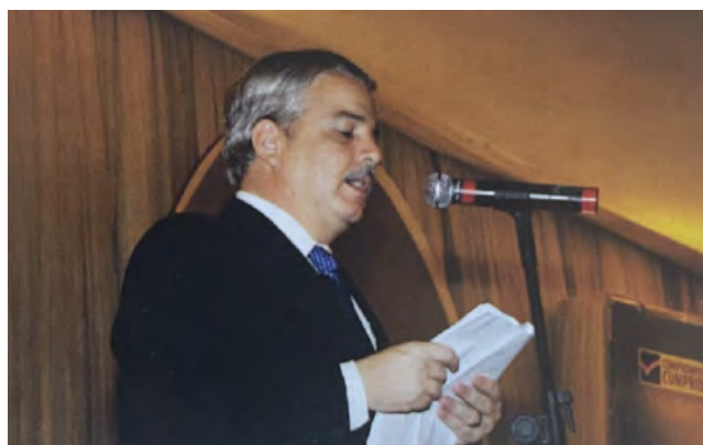
Inauguração do Hospital Pelopidas Silveira

Ampliação dos investimentos da saúde pública; Construção do Hospital Metropolitano Pelopidas Silveira; Incorporação do Hospital do Câncer e do Dom Malan (Petrolina) à rede estadual; Revitalização e reabertura do Hospital Ermírio Coutinho, em Nazaré da Mata; e das maternidades Brites de Albuquerque, em Olinda, e Petrolina Campos, em São Loureço da Mata; Construção de cinco hospitais após enchentes: Hospital Regional de Palmares, Hospitais Municipais de Córtes, Barreiros, Jaqueira e Água Preta; Implantação de 15 UPAs e nove UPAEs; Reformas de ampliação em toda a rede de grandes emergências, como os hospitais Regional do Agreste, Otávio de Freitas e Agamenon Magalhães; Construção e compra de equipamentos para o Hospital Mestre Vitalino, em Caruaru; Construção do Hospital da Mulher de Caruaru; Reabertura do Hospital São Sebastião de Caruaru; Construção do Bloco anexo do Hospital do Câncer; Ampliação do serviço do SAMU de 30 para cerca de 150 municípios, beneficiando cerca de 80% dos pernambucanos; Implementação da gestão do Pacto pela Saúde; Lançamento do Programa Sanar – combate às sete doenças negligenciadas; Início das obras do Plano Diretor de Obras do Hospital Barão de Lucena; Diversas ações de reformas físicas e adequações estruturais estratégicas no Hospital da Restauração; Reforma de reestruturação e ampliação da Emergência do Hospital Getúlio Vargas;