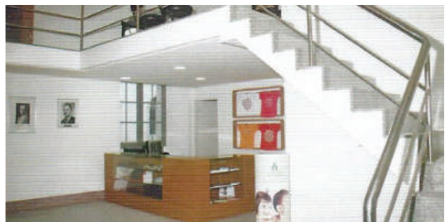
Inauguração da nova sede da FAF