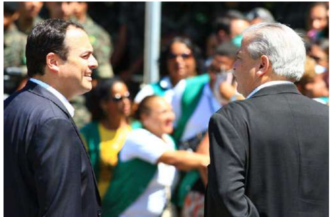
O ex-governador Paulo Câmara e Antônio Carlos Figueira

Em 2017, deixou a Casa Civil e assumiu a chefia da Assessoria Especial do Governo do Estado, em que permaneceu até 2020.