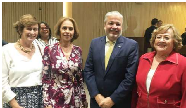
Homenagem na Alepe