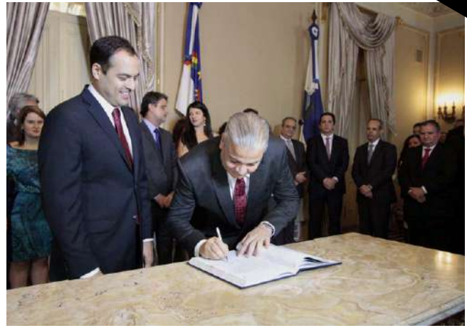
Posse na Casa Civil