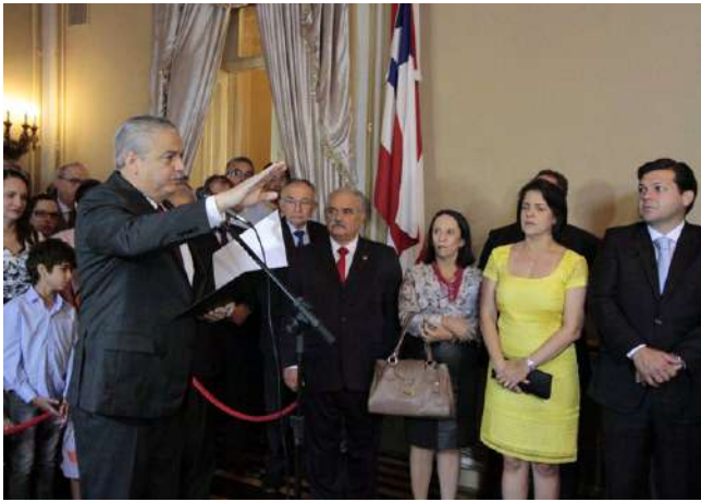
Posse na Casa Civil