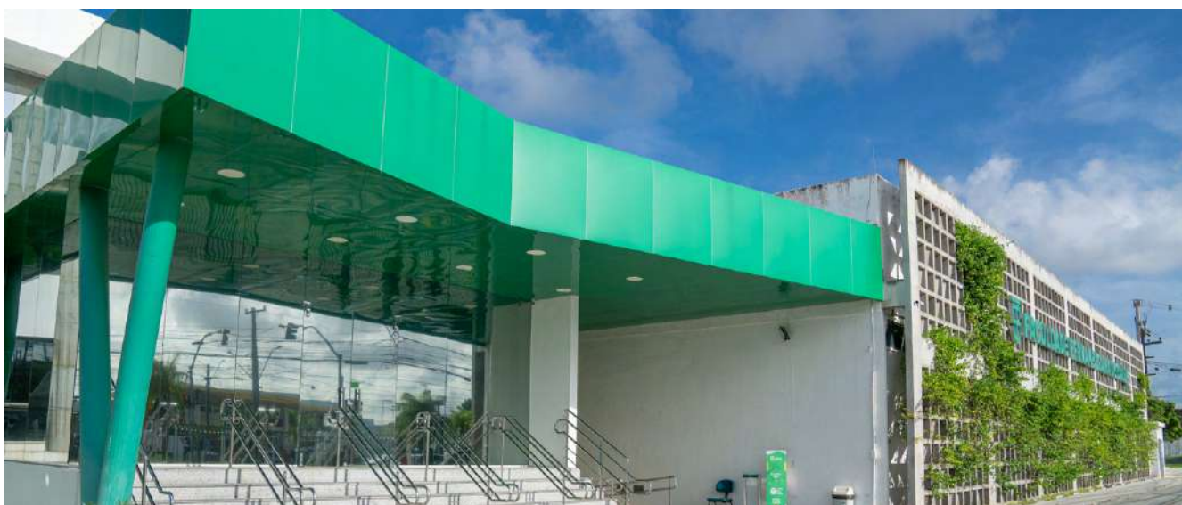
Faculdade Pernambucana de Saúde (FPS)

Em julho de 2021, em meio à pandemia de Covid-19, foi inaugurado o Centro de Eventos Prof. Fernando Figueira, destinado à realização de congressos e conferências. O espaço, todo equipado com tecnologia de ponta, conta com auditório, foyer, anfiteatro e salas modulares que comportam até 220 lugares