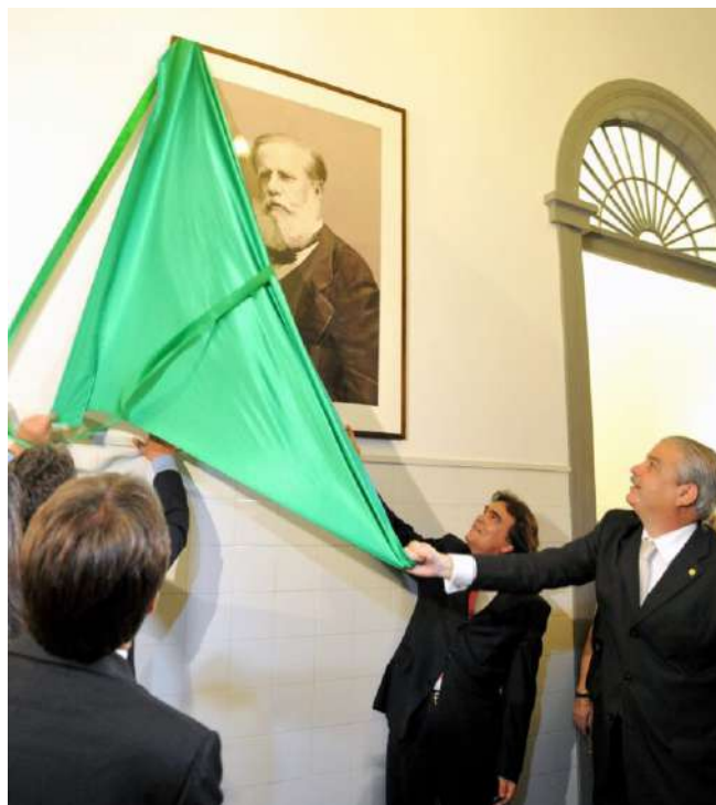
Inauguração do Ambulatório Central

Também foi em sua gestão que ocorreram, entre muitas outras iniciativas, a reforma, a revitalização e a modernização do Centro Hospitalar Oscar Coutinho; a implantação da Assistência Integral para todas as idades; a concepção do perfil institucional para Alta Complexidade; a instituição assistencial no IMIP para atendimento exclusivo ao SUS; a Certificação do IMIP como Hospital de Ensino