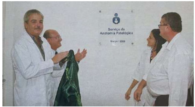
Inauguração do Serviço de Anatomia Patológica