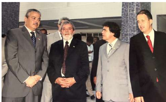
Recebendo autoridades no IMIP