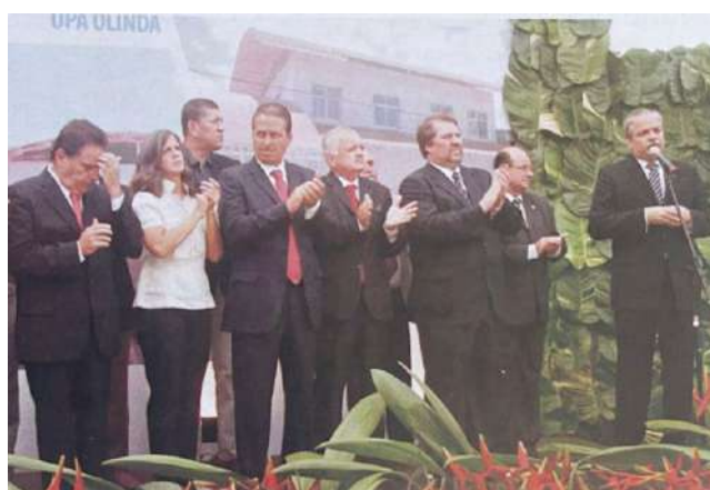
Gestão das UPAs

Reforma e ampliação do Hospital Belarmino Correia, em Goiana; Entrega da primeira etapa da grande reforma e ampliação do Hospital Regional Dom Moura, em Garanhuns; Desenvolvimento de cinco novos sistemas de informação: Mãe Coruja, Lei Seca, Seleção Simplificada, Projeto Boa Visão e Controle de Repasse Financeiro (SICREF); Implantação de urgências odontológicas 24h (Laboratório de próteses e fluoretação das águas) nas UPAs e Regionais de Saúde; Construção do plano de política cardiológica; Implantação do Programa de Telecardiologia – uma inovação no Estado; Monitoramento da vigilância dos óbitos maternos, fetais e infantis; Implantação dos laboratórios de controle de qualidade da água para consumo humano nas 12 Regionais de Saúde;