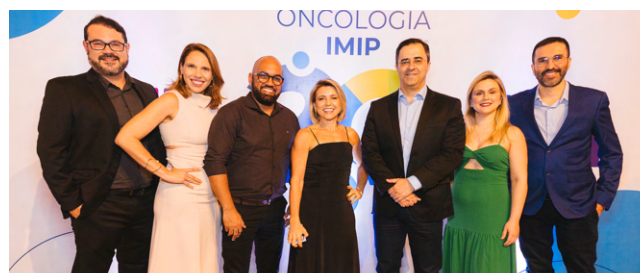
A comemoração foi muito prestigiada

setor da Oncologia, o IMIP inaugurou em 2019 o primeiro biobanco do Nordeste, que funciona com a coleta e o armazenamento de material molecular de tumores para fins de pesquisa e, consequentemente, desenvolvimento de novas técnicas de tratamento.