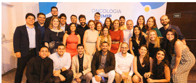
O evento reuniu gestores e profissionais de diversos serviços do IMIP