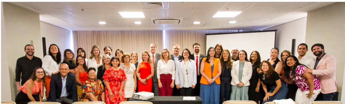
Profissionais presentes no evento