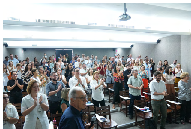
O evento foi realizado no Auditório Alice Figueira

De acordo com a descrição do Projeto, o objetivo é refletir sobre a identidade e a presença do IMIP nessa época rica de transformações de toda ordem, bem como sobre a filosofia, o estilo de liderança, a cultura de gestão e a sua inserção junto à sociedade – 1º, 2º e 3º setores – e à comunidade científica, assistencial e educacional.