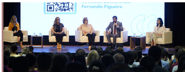
Mesa de Abertura