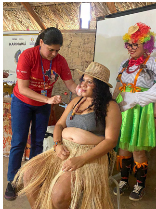
Representantes da Saúde Indígena do IMIP participaram do evento de abertura do Mês de Vacinação dos Povos Indígenas, no município de Inajá, no sertão de Pernambuco