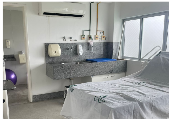
Centro de Parto Normal

O espaço, que tem capacidade para atender 70 gestantes mensalmente, possui uma área de 221m 2 , com 5 leitos, em ambientes compartilhados com o restante da maternidade, como recepção, sala de exames, posto de enfermagem, sala de serviço e outros ambientes de apoio. Um dos quartos dispõe de uma banheira para maior conforto e relaxamento. Todos os banheiros são individuais, com chuveiro e água quente, para alívio das dores do trabalho de parto.