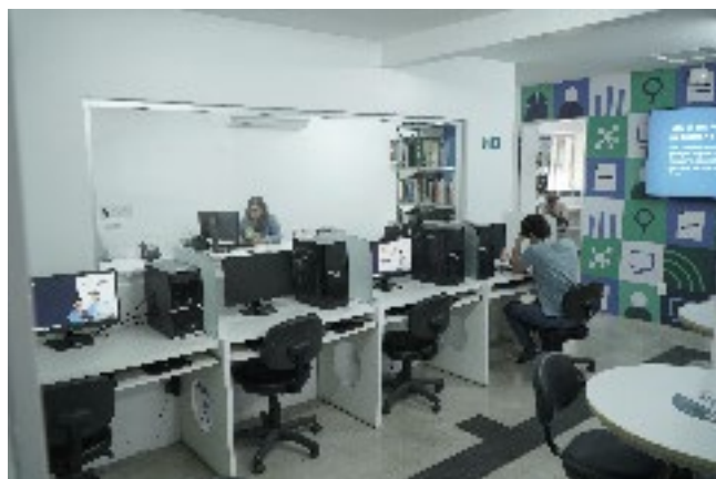
O espaço conta com espaços individualizados para estudo

A Biblioteca Ana Bove fica localizada no prédio de Ensino e Pesquisa. O horário de atendimento presencial é de segunda a quinta-feira, das 7h às 17h; e na sexta-feira, das 7h às 16h. Mais informações podem ser obtidas pelo e-mail: biblioteca@imip.org.br ou pelo telefone: 2122-4139.