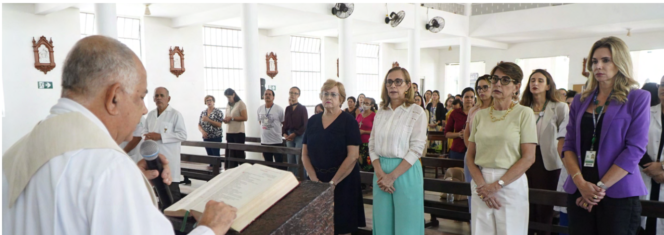
Muitos gestores prestigiaram a celebração