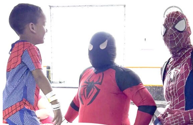
Os super-heróis visitaram o Hospital Geral de Pediatria e a Oncologia Pediátrica

Essa é uma iniciativa, inserida em um contexto maior de humanização, que eles realizam a cada dois meses, sendo uma forma de distrair os pequenos pacientes com momentos de diversão e encanto, elementos que ajudam a alcançar uma recuperação satisfatória.