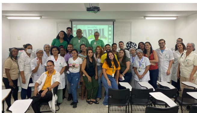
A equipe do SESMT e participantes da ação