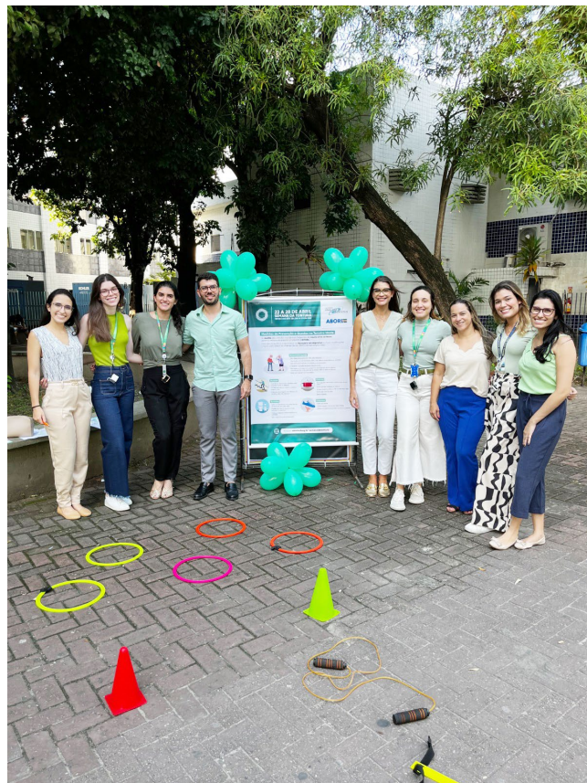
A atividade foi realizada na área central do IMIP

Localizado na parte mais interna do ouvido, o labirinto é uma estrutura responsável pela audição, pelo equilíbrio e pela percepção corporal. Assim como outras partes do ouvido, a região está sujeita a sofrer alterações, denominadas doenças do labirinto, que podem comprometer seu correto funcionamento e causar complicações à saúde do paciente.