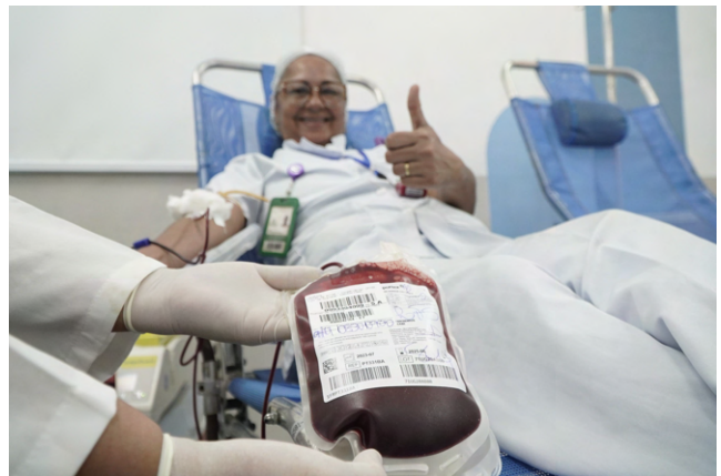
A campanha contou com a participação de 117 doadores aptos