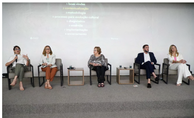
Mesa de Abertura

O Projeto Perenidade consiste numa consultoria iniciada em 2023, lembrando o caminho percorrido pela instituição, reconhecendo os aprendizados, as vitórias e os desafios, para assim ter uma perspectiva do futuro do IMIP.