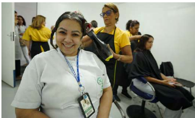
Foram ofertados diversos serviços de beleza