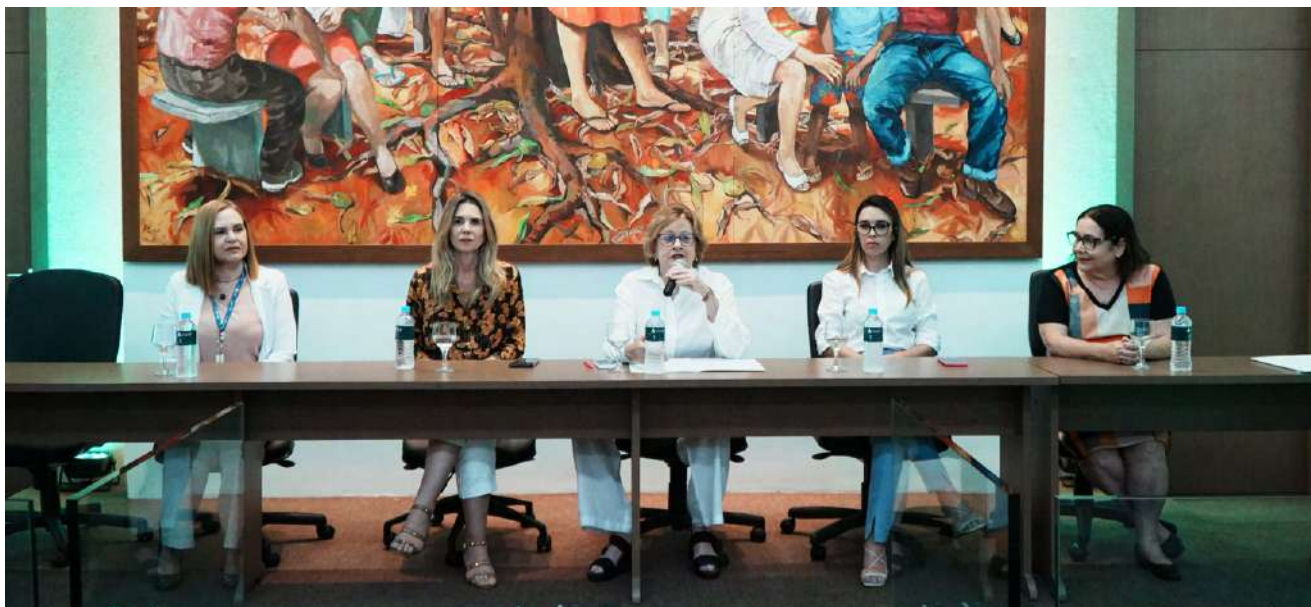
Mesa de Abertura