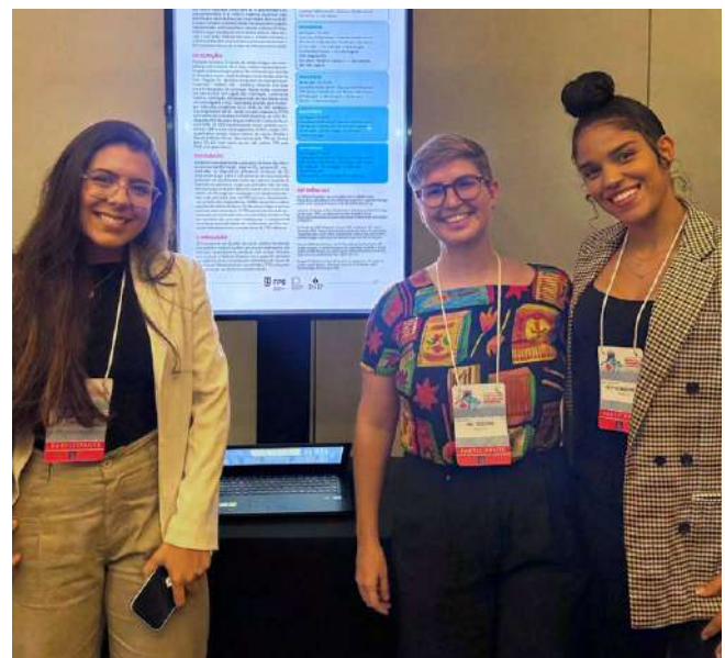
O trabalho analisou dados de crianças e adolescente com cetoacidose diabética

O trabalho, realizado entre os meses de janeiro e dezembro de 2023, teve como objetivo caracterizar o perfil clínico epidemiológico e o manejo de crianças e adolescentes com diagnóstico da doença, atendidos ao longo do ano no IMIP. Para o estudo, foram incluídos pacientes que preenchiam critérios para cetoacidose diabética (CAD), de 0 a 15 anos, sem critério de exclusão. Os dados foram analisados no programa Stata®18.0 e apresentados em tabelas.