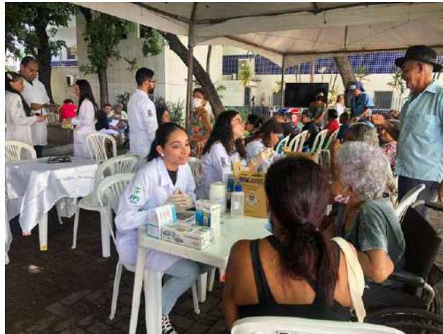
A atividade ofereceu serviços gratuitos de saúde

Outra pesquisa da Associação Brasileira das Indústrias Farmacêuticas (Abifarma) mostrou que aproximadamente 20 mil pessoas