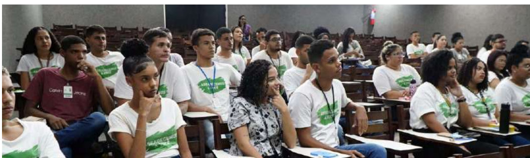
O evento foi realizado no Auditório Alice Figueira

Reconhecimento – Em 2016, durante o II Encontro de Empresas Parceiras do Programa Jovem Aprendiz, promovido pela Escola Dom Bosco, o IMIP recebeu o Prêmio de Honra ao Mérito em reconhecimento ao desempenho, à participação e à contribuição, alcançando o resultado de inserções efetivas de jovens no seu quadro de funcionários no programa Jovem Aprendiz.