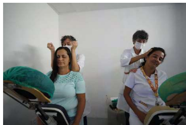
A programação também contou sessões de massagem