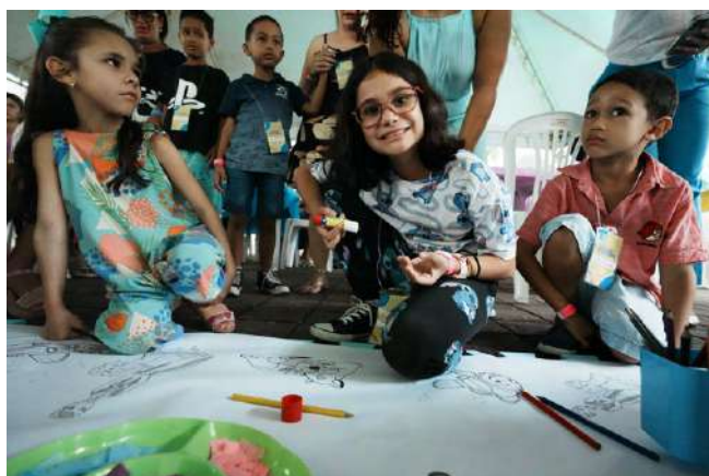
As crianças participaram de muitas atividades

programa que eles amavam. Creio que os filhos de vocês também vão ficar encantados com a programação de hoje. Aproveito e parablenho à Diretoria de Recursos Humanos pela iniciativa”, ressaltou a Presidente.