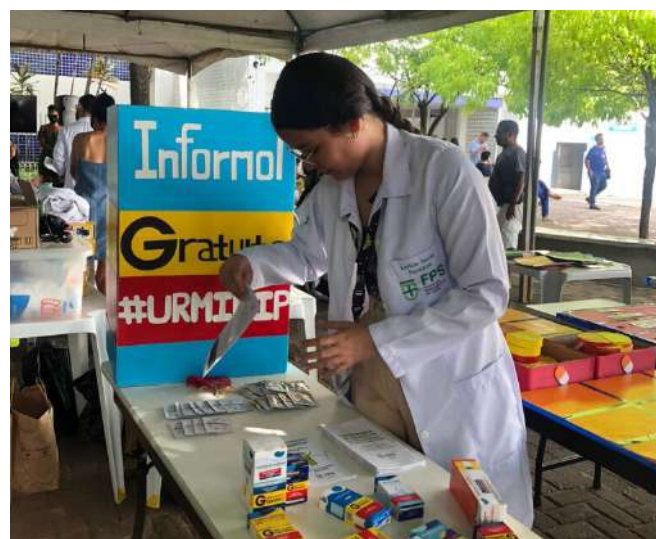
A ação foi realizada na Praça da Santa do IMIP

morrem anualmente no Brasil em decorrência da automedicação.