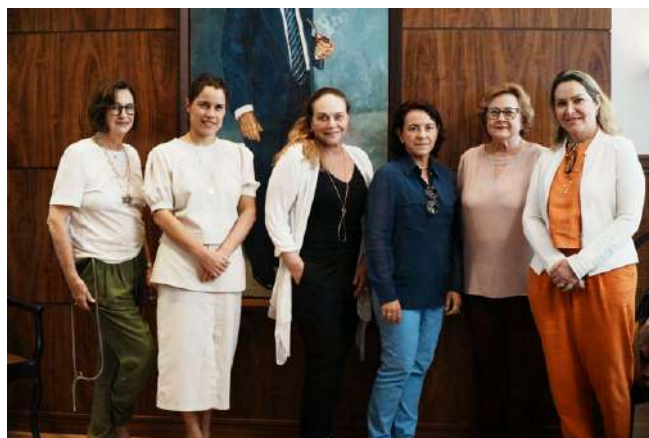
Gestoras recebem as representantes

Apoiar um projeto de desenvolvimento social por meio de leis de incentivo fiscal é uma forma importante de destinar parte do seu Imposto de Renda devido para o hospital. Os projetos no IMIP foram criados para dar continuidade ao trabalho do Instituto complemen-