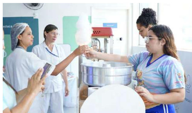
Os participantes se deliciaram com muitas guloseimas