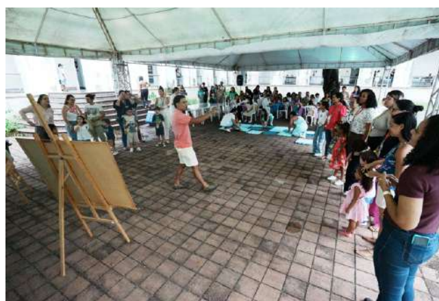
As atividades foram realizadas nos Espelhos d'água do Hospital Pedro II