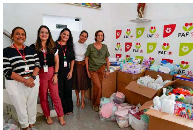
O IMIP recebeu quase uma tonelada de alimentos