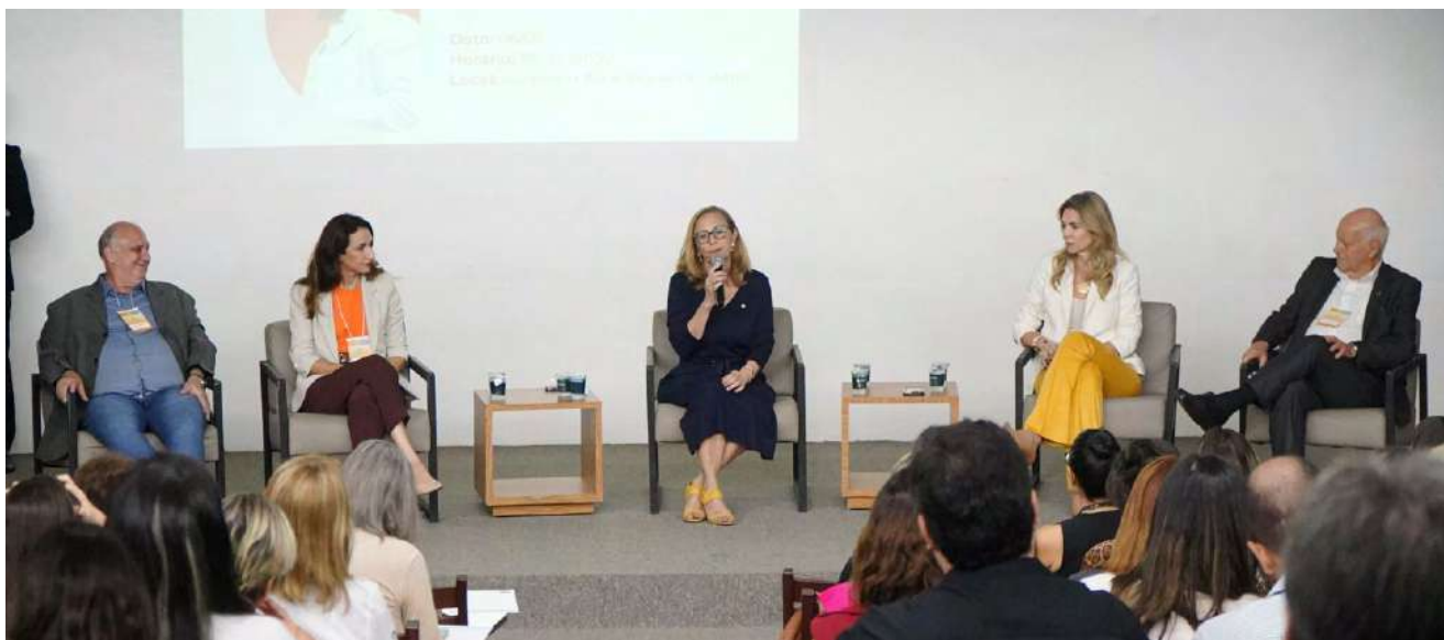
Mesa de Abertura