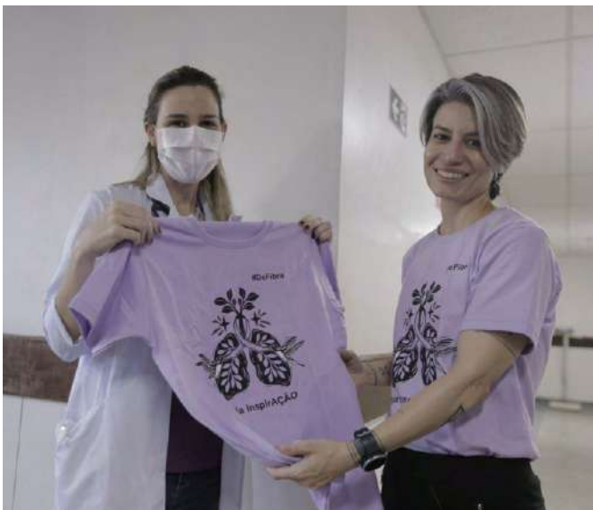
IMIP é o único centro de referência em Pernambuco para o tratamento desses pacientes

Transmitida pelo pai ou pela mãe, a fibrose cística altera o mecanismo que regula a água e o sal em diversos sistemas do corpo, como o respiratório e o digestivo. Segundo o Grupo Brasileiro de Estudos de Fibrose Cística (GBEFC), mais de 6 mil pessoas no Brasil viviam com a doença em 2020. Em Pernambuco, o Instituto de Medicina Integral Professor Fernando Figueira (IMIP) é o único centro de referência no tratamento de FC, acompanhando cerca de 140 pacientes.