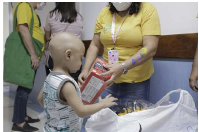
Campanha de 2023

Ela destaca que empresas pernambucanas e grupos que desejem abraçar a iniciativa podem entrar em contato com a FAF através