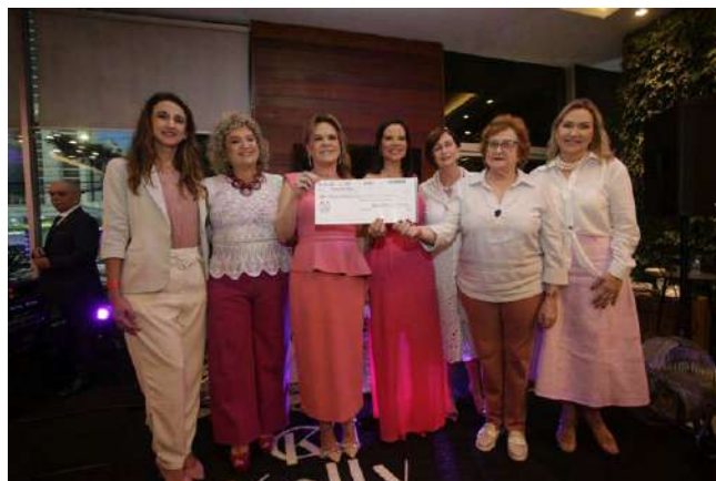
Entrega do cheque simbólico no valor de R$ 30 mil

"Estamos muito felizes com o sucesso da arrecadação da campanha do Outubro Rosa deste ano! Toda a renda será destinada ao IMIP, uma instituição filantrópica 100% SUS, reconhecida nacional e internacionalmente por sua excelência na área da saúde. Agradecemos imensamente a todos que contribuíram para essa iniciativa