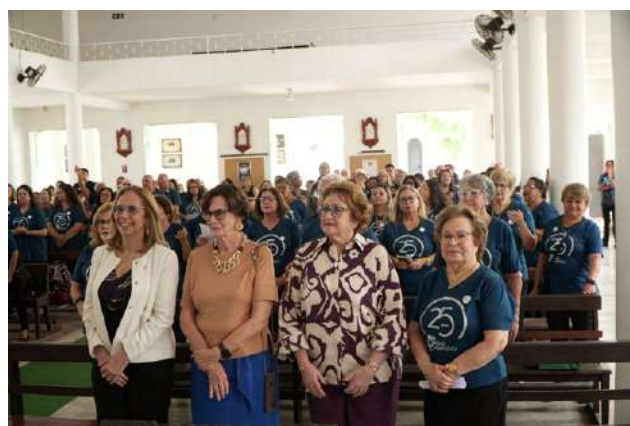
A Capela ficou lotada

Os voluntários atuam em 25 setores do Complexo Hospitalar do IMIP (Ambulatório Central, Alojamento Conjunto, Boutique, Brinquedoteca, Biblioteca Itinerante, Capela, Cuidados Paliativos, Coordenadores, Endoscopia, Enfermaria de Alto Risco e do Coração, Grupo Desperta e Vem Cantar, Grupo Autoestima, Hemodiálise Infantil e Adulto, Laboratório, Método Canguru, Oncogeriatría, Oncopediatría, Oficinas de Trabalhos Manuais e Prótese Mamária, Quimioterapia, Radiologia, Recepção Geral e Salão de Beleza), proporcionando momentos felizes para crianças, adultos