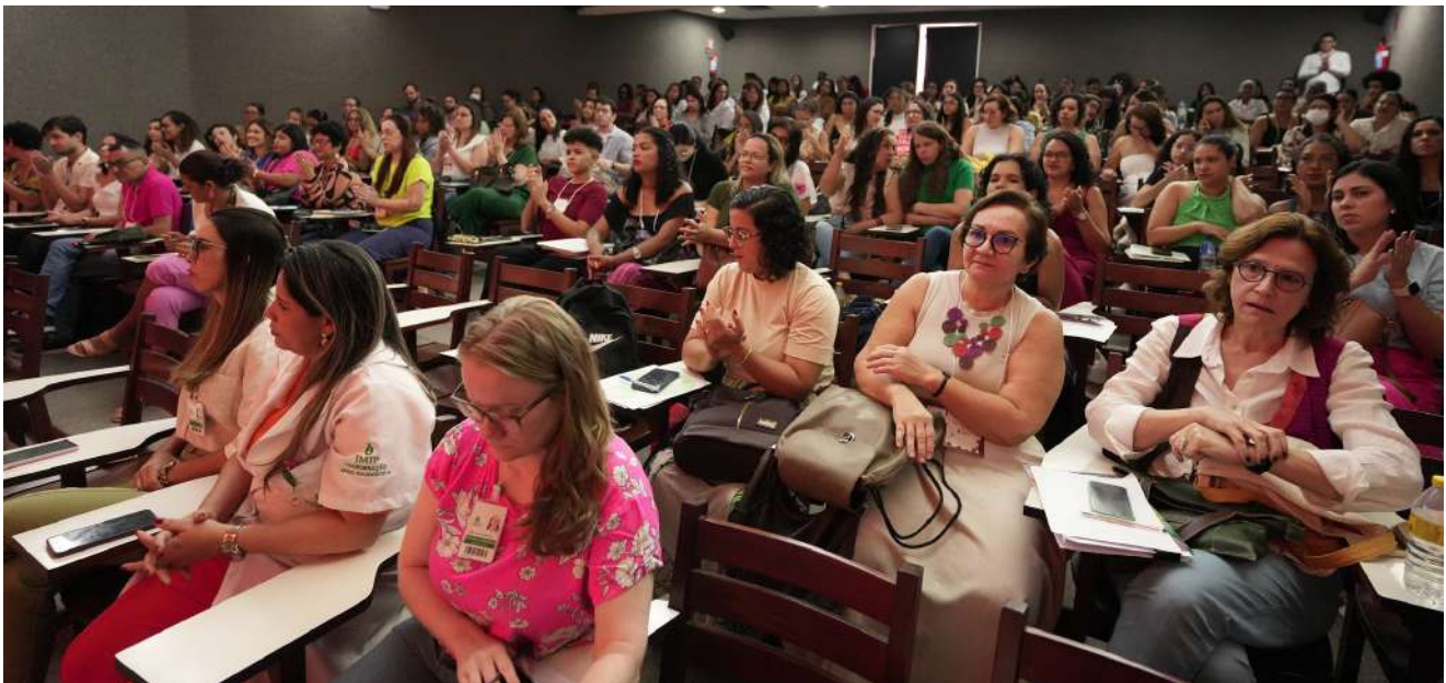
O Auditório Alice Figueira ficou lotado