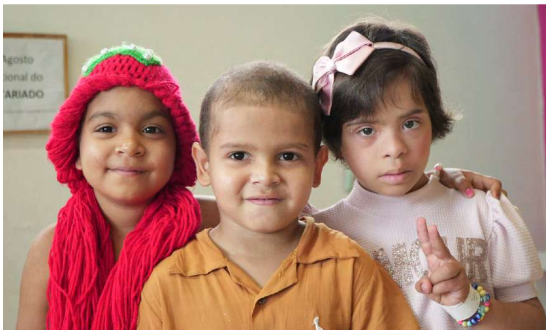
Pacientes da Oncologia Pediátrica do IMIP

A Oncologia Pediátrica do IMIP realiza cerca de 1.500 consultas mensais para pacientes com suspeita ou diagnóstico de câncer infantojuvenil. O serviço oferece atendimento médico especializado, com capacidade para acolher 31 crianças e adolescentes em leitos de enfermaria e seis na UTI. Além do tratamento médico, os pacientes recebem suporte psicossocial, terapêutico, odontológico e educacional, garantindo um cuidado integral.