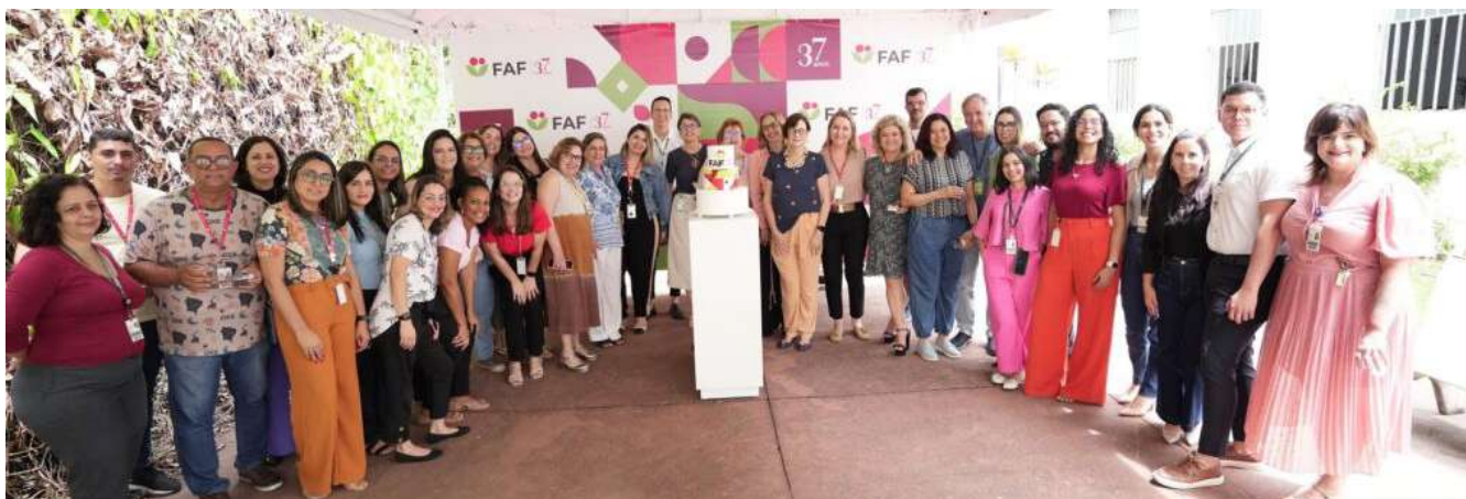
A comemoração reuniu muitos imipianos

Ao longo dos anos, a FAF desenvolveu diversas campanhas e projetos que se tornaram essenciais para o cumprimento dos propósitos sociais e científicos do IMIP, beneficiando diretamente seus usuários. Entre as ações de destaque estão Troco Solidário, Bazar, Exposição de Artes, Cofrinho, Empresa Solidária, Quiosques e diversas campanhas de Telemarketing. Cada iniciativa e projeto, mesmo diante de desafios diários, são fortalecidos pela participação ativa e pela solidariedade da comunidade.