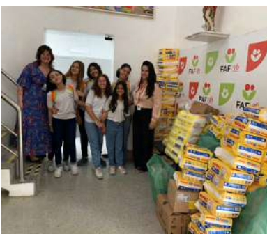
Colégio e Curso Desafio

Dentro das ações do Projeto Escola Solidária, lançado pela Fundação Alice Figueira de Apoio ao IMIP (FAF) no primeiro semestre de 2024, a FAF recebeu, no mês de setembro, significativas doações do Colégio Elo – Boa Viagem e do Colégio e Curso Desafio.