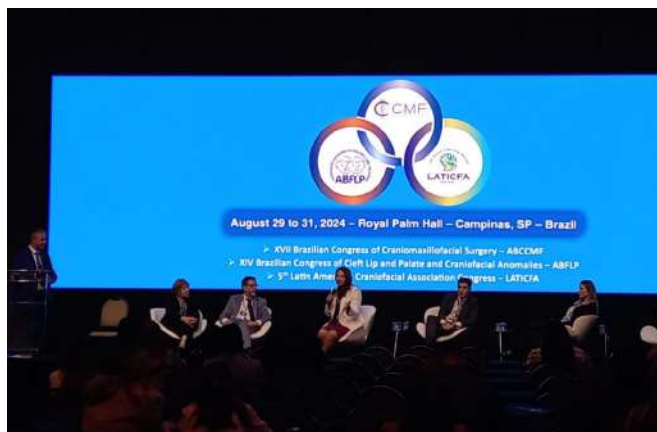
O Congresso foi realizado em Campinas-SP