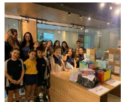
Colégio Elo – Boa Viagem

O Colégio Elo doou mais de 3.770 itens de higiene bucal, como escova de dente, creme dental e enxaguante bucal. Já o Colégio e Curso Desafio doou mais de 5 mil itens de higiene pessoal, como fralda descartável, lenço umedecido e sabonete infantil. A FAF agradece às duas instituições.