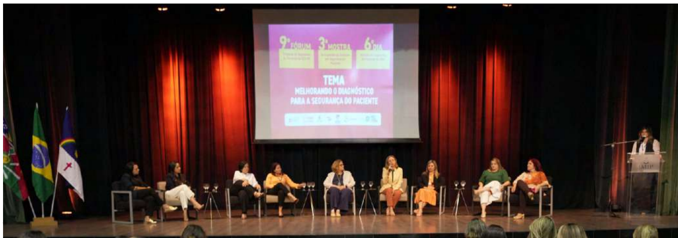
Mesa de Abertura