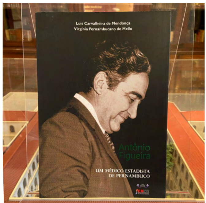
Capa do livro

de Pernambuco. A Faculdade de Medicina de Pernambuco nomeou o setor de Emergências Cardiológicas do Hospital Universitário Oswaldo Cruz (HUOC) em sua homenagem. Sua contribuição para a Pediatria foi registrada no livro História da Pediatria Brasileira, e ele foi indicado patrono da Cadeira nº 20 da Academia Brasileira de Pediatria.