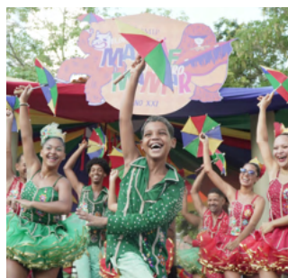
Passistas de frevo