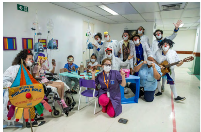
Bloco Miolinho Mole

“A nossa ideia é que as crianças que estão internadas, enfrentando doenças que pedem tratamentos longos, também possam brincar o