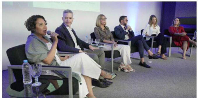
Mesa de Abertura