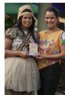
Vencedores do concurso de fantasia (categoria adulto)