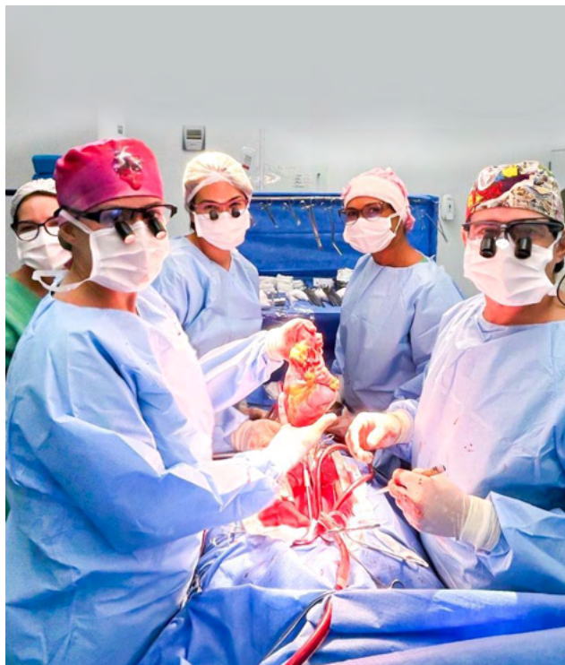
Equipe responsável pelo procedimento