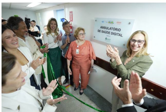
Descerramento da placa

Ambulatório – As intervenções digitais no ambulatório englobam os quatro eixos da Classificação das Intervenções Digitais em Saúde da Organização Mundial da Saúde (OMS): facilitar o estadiamento e o