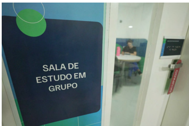
Salas para estudo em grupo