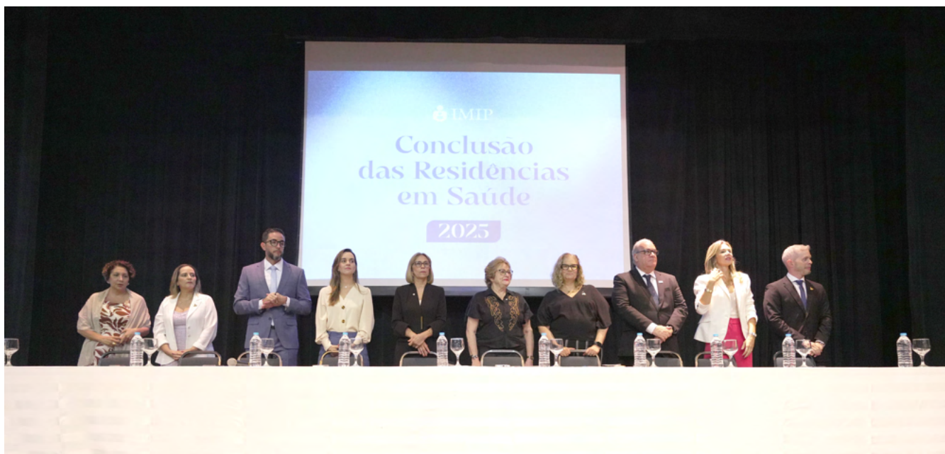
Mesa de Abertura