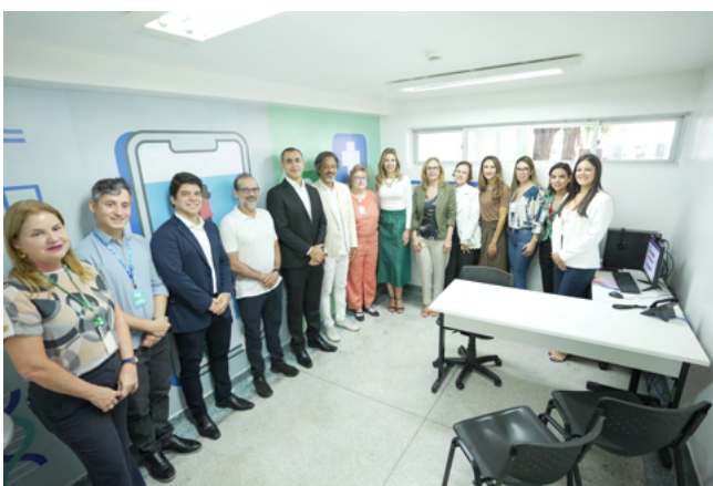
Gestores presentes na inauguração

início do tratamento oncológico no tempo adequado; garantir suporte contínuo ao paciente ao longo de sua jornada de tratamento; e oferecer capacitação e suporte técnico a profissionais de saúde que atuam em instituições sem habilitação para oncologia.