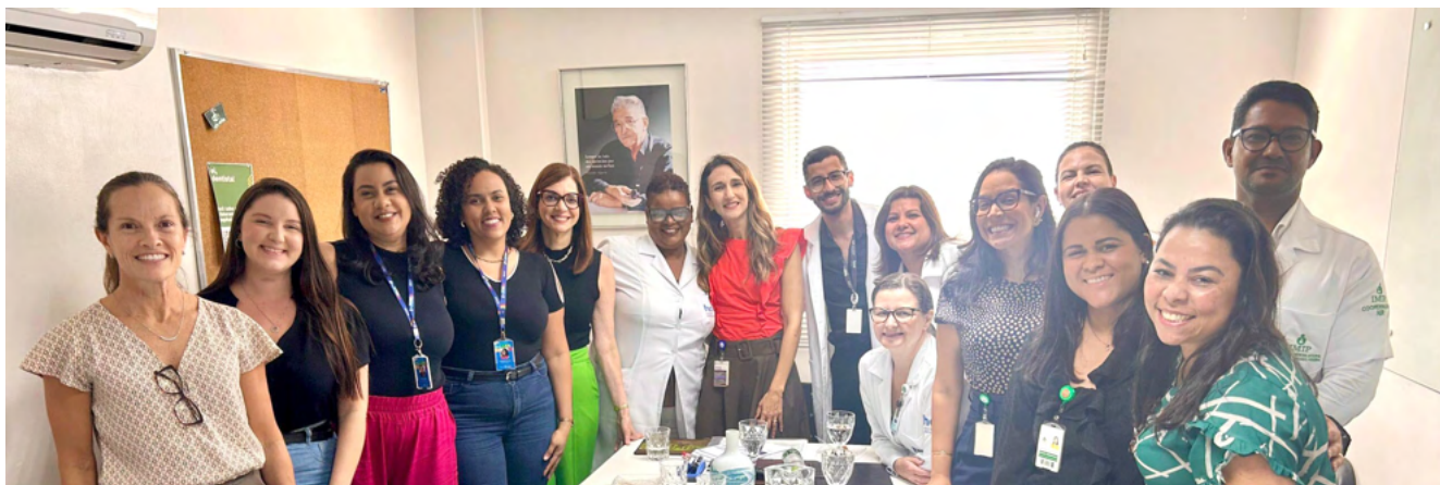
O grupo foi recebido por gestores das equipes multidisciplinares que atendem as crianças cardiopata