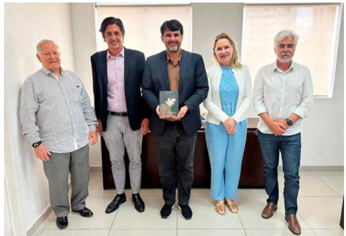
Os livros foram entregues na sede do Cremepe

Foi agraciado com diversas honrarias, entre elas as medalhas de Mérito Médico, concedidas pelo Governo Federal e pelo Estado