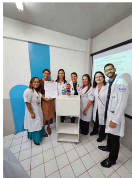
Treinamento das equipes