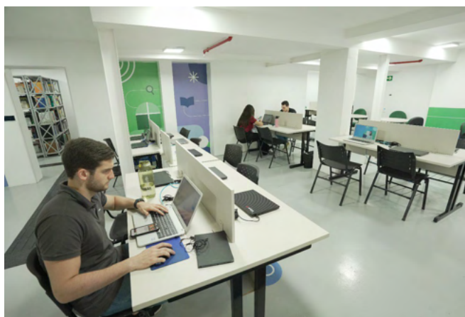
Computadores com acesso à internet