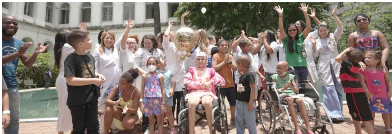
No dia 15 de fevereiro, profissionais de saúde, pacientes e familiares soltaram balões próximo aos espelhos d'água

Além do atendimento médico específico, os pacientes recebem suporte multidisciplinar, incluindo assistência psicossocial, terapêutica, odontológica e educativa.