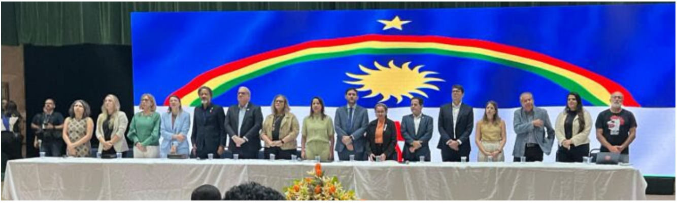
A solenidade foi realizada no Teatro Guararapes