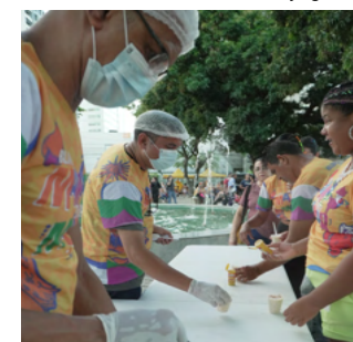
Distribuição do mungunzá