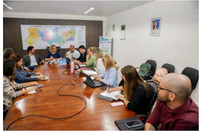
Encontro realizado na SES

O programa é composto por três componentes principais: fila única, telessaúde e cirurgias eletivas, promovendo maior eficiência