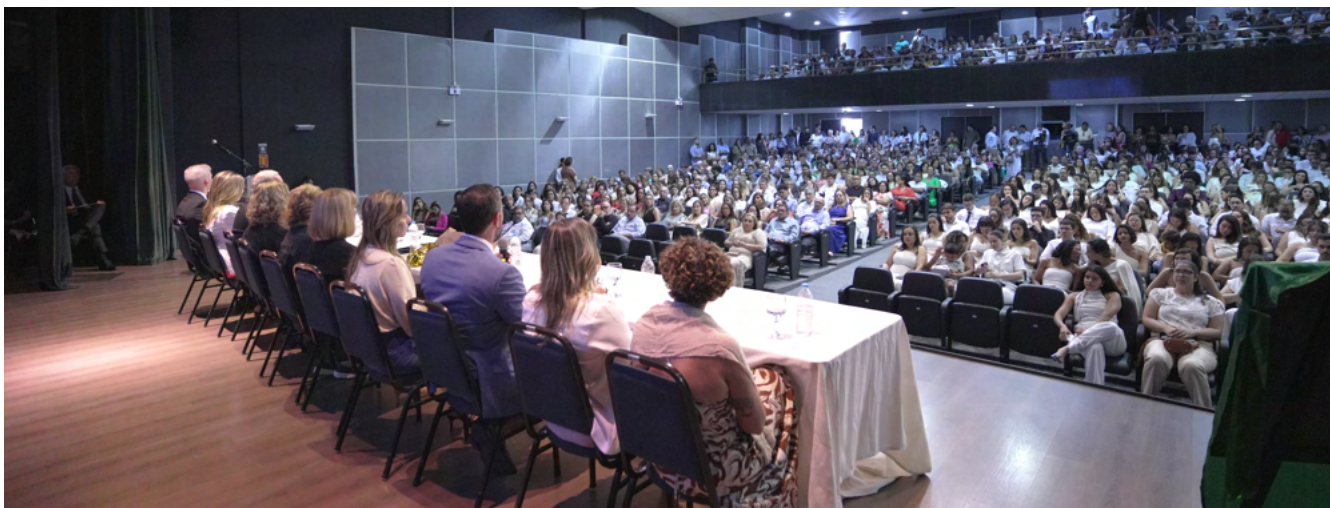
Espaço Ciência e Cultura

Após o descerramento da placa, a programação seguiu com uma missa em ação de graças, celebrada pelo capelão do IMIP, Padre Bené, na Capela de Nossa Senhora das Graças (Hospital Pedro II).