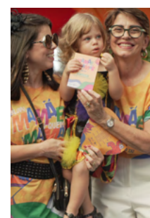
Vencedores do concurso de fantasia (categoria infantil)