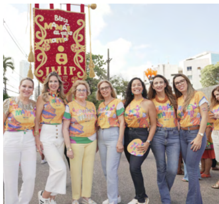
Gestoras do IMIP