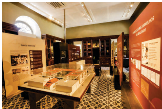
Museu do IMIP

O Museu conta também com a Sala de Vídeo, a Sala IMIP e a Sala Fernando Figueira, que exibem publicações científicas, prêmios, documentos, fotografias, biografias, instrumentos médicos utilizados em décadas passadas e outros registros que revelam a dimensão do trabalho e da visão