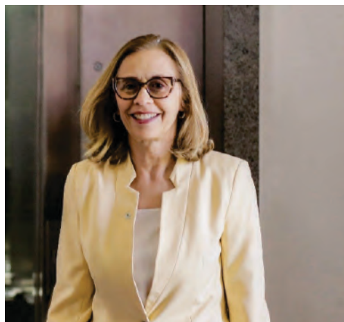
Texto produzido por Tereza Campos – Superintendente Geral do IMIP e publicado no Jornal do Commercio, no dia 21 de novembro de 2025

Nesse contexto, o IMIP reafirmou sua vocação de lutar pela equidade, colocando a justiça social e a justiça ambiental no centro da agenda climática. Afinal, os impactos ambientais não se distribuem de forma igual. Eles recaem com maior força sobre comunidades periféricas, povos originários e populações que já enfrentam barreiras de acesso à saúde.