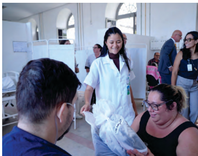
Os itens foram entregues aos pacientes internados em diversos setores do hospital