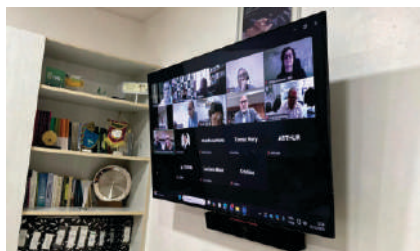
A videoconferência com parlamentares foi realizada no dia 7 de novembro