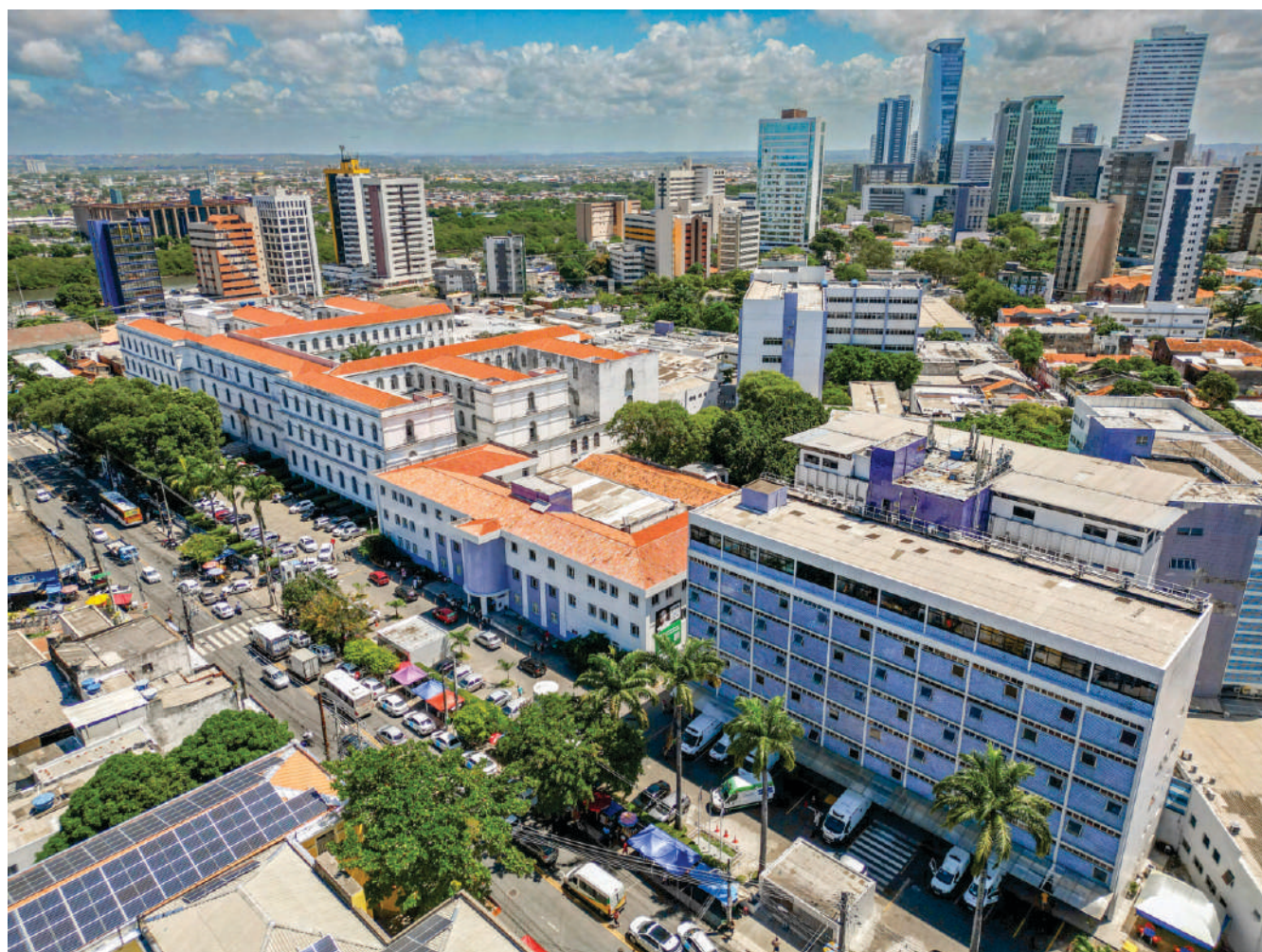
Complexo Hospitalar do IMIP