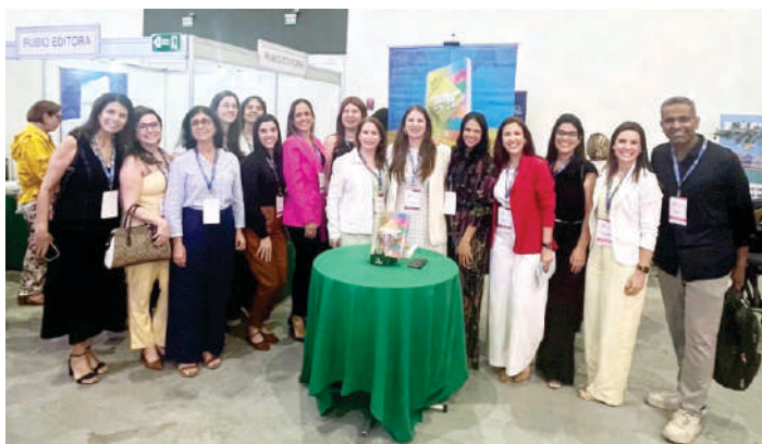
A obra foi lançada durante o 16º Congresso Brasileiro Pediátrico de Endocrinologia e Metabologia (Cobrapem)