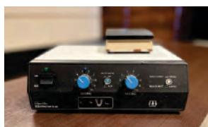
O museu conserva algumas relíquias, entre elas, o primeiro bisturi elétrico de Pernambuco