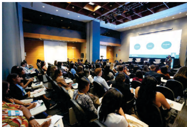
Auditório do JCPM Trade Center

Durante os três dias de programação, foram ministrados minicursos sobre Estrutura e Gestão de Centro de Pesquisa Clínica e sobre Gestão de Dados e Auditoria em Pesquisa Clínica, além de mesas-redondas conduzidas por especialistas e da apresentação de pôsteres. Ao todo, foram 250 inscritos, 40 palestrantes e 35 trabalhos apresentados.