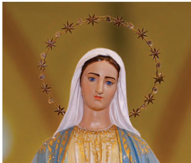
Nossa Senhora das Graças

A programação contou ainda com recitação do Terço, Ladainha de Nossa Senhora e uma Celebração Eucarística, marcando um momento de fé, gratidão e comunhão entre todos que fazem parte dessa grande obra de amor ao próximo, chamada: IMIP.