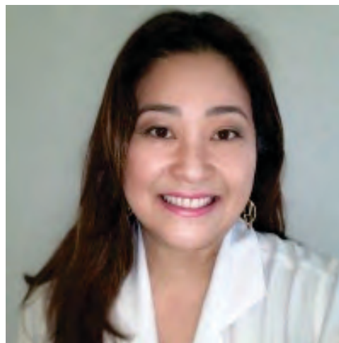
Texto produzido por Chika Wakiyama é nutricionista do IMIP, Coordenadora do Lactário do IMIP e da Residência em Nutrição Clínica e publicado no dia 25 de novembro, no Diário de Pernambuco

Pensando nos pacientes assistidos e visando garantir a segurança nutricional desses pacientes, o IMIP, em parceria com o Conselho Municipal de Defesa e Promoção dos Direitos da Criança e do Adolescente da Cidade do Recife (COMDICA), requalificou o serviço de Nutrição do Lactário/Sondário e Fracionamento de Leite Humano. O espaço, inaugurado em abril de 2025, foi projetado em conformidade com resoluções e portarias, contando com infraestrutura aprimorada e tecnológica, através da aquisição de equipamentos de ponta. Oferece, assim, maior segurança nos